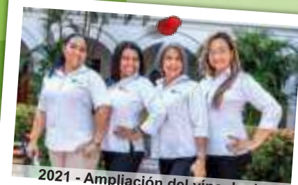
2021 - Ampliación del vínculo de asociación a todos los funcionarios de la Universidad de Cartagena