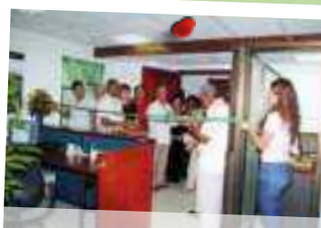
2007 - Inauguración Oficina Banco Popular