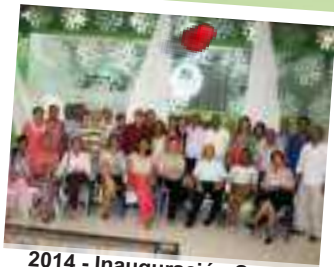
2014 - Inauguración Sede Milciades Zúñiga Lorduy