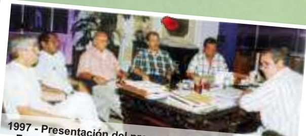
1997 - Presentación del proyecto Fondo de Empleados Fonducar al Rector de la Universidad de Cartagena