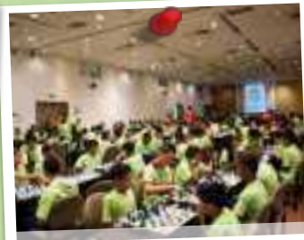
2018 - X Torneo de Ajedrez