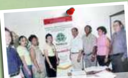
2000 - Primera oficina del Fondo