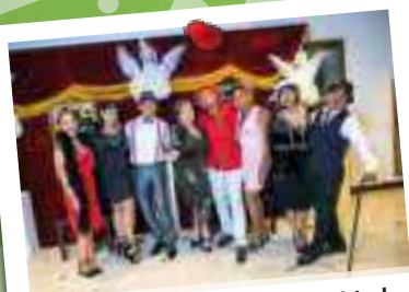
2018 - Fiesta de la Solidaridad, motivos años 20