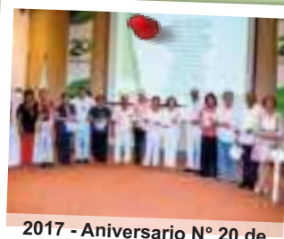
2017 - Aniversario N° 20 de Fonducar, reconocimiento a asociados fundadores