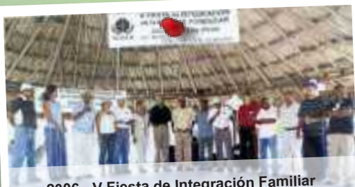
2006 - V Fiesta de Integración Familiar