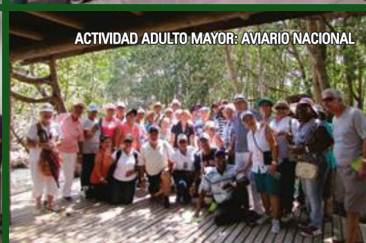
ACTIVIDAD ADULTO MAYOR: AVIARIO NACIONAL