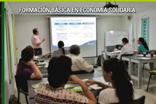
FORMACIÓN BÁSICA EN ECONOMÍA SOLIDARIA