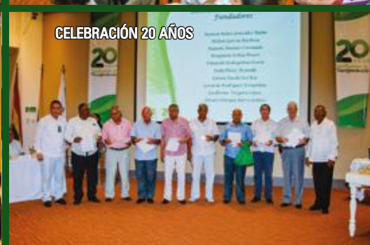
CELEBRACIÓN 20 AÑOS