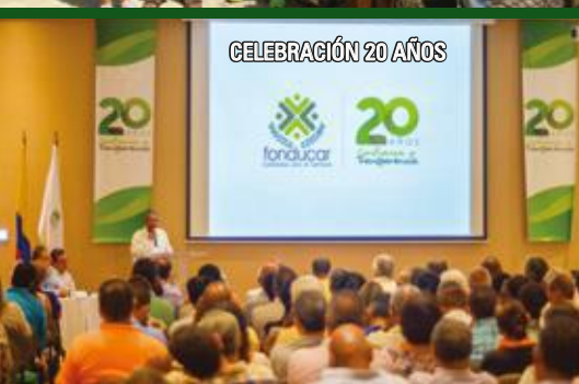
CELEBRACIÓN 20 AÑOS