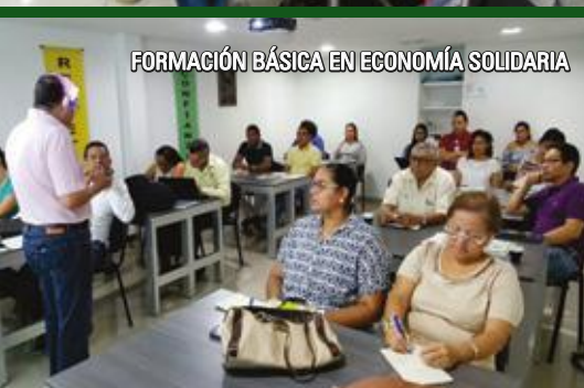
FORMACIÓN BÁSICA EN ECONOMÍA SOLIDARIA