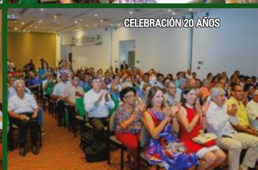
CELEBRACIÓN 20 AÑOS