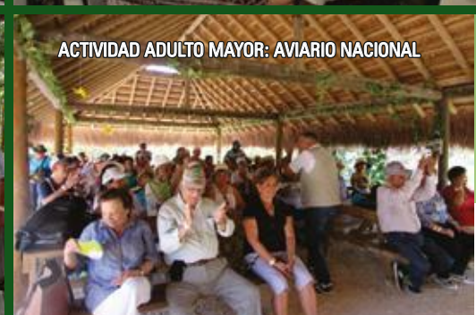
ACTIVIDAD ADULTO MAYOR: AVIARIO NACIONAL