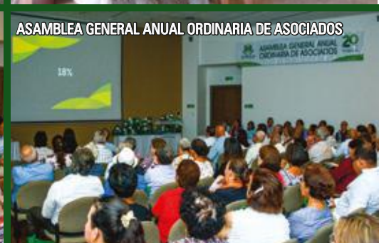
ASAMBLEA GENERAL ANUAL ORDINARIA DE ASOCIADOS