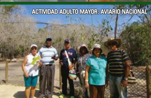
ACTIVIDAD ADULTO MAYOR: AVIARIO NACIONAL