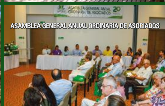
ASAMBLEA GENERAL ANUAL ORDINARIA DE ASOCIADOS