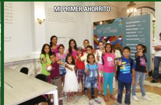
MI PRIMER AHORRITO