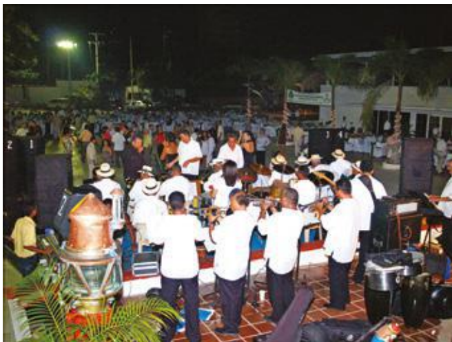
Año 2007. Fiesta de la solidaridad

de los asociados, no era un desafío de poca monta, significaba el compromiso de estar renovando la cuerda motora de la visión.