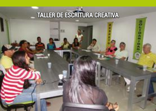
TALLER DE ESCRITURA CREATIVA