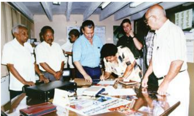
Año 1997. Primera oficina de Fonducar, compartida con ASODUC.