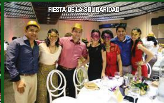
FIESTA DE LA SOLIDARIDAD