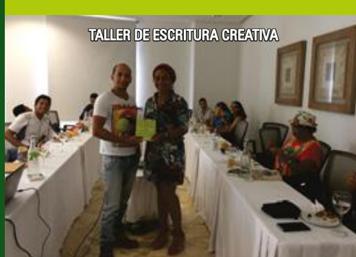
TALLER DE ESCRITURA CREATIVA