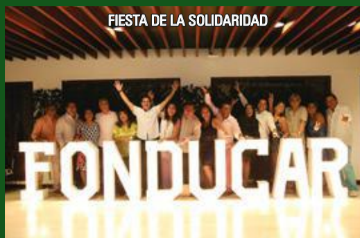
FIESTA DE LA SOLIDARIDAD