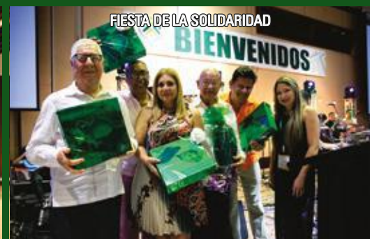
FIESTA DE LA SOLIDARIDAD