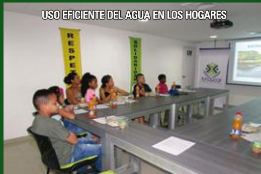
USO EFICIENTE DEL AGUA EN LOS HOGARES