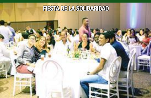
FIESTA DE LA SOLIDARIDAD