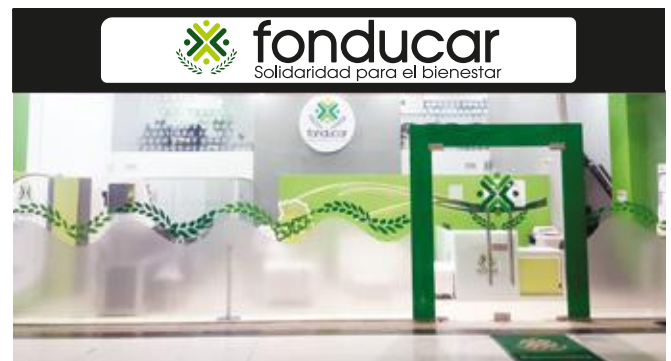
Instalaciones actuales de Fonducar, ubicadas en el Centro Comercial Portal de San Felipe.