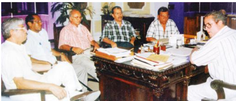
Año 1997. Presentación del proyecto Fondo de Empleados - Fonducar al Rector de la Universidad de Cartagena.