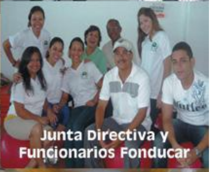
Junta Directiva y Funcionarios Fonducar