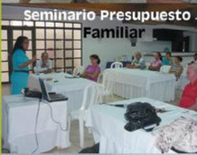
Seminario Presupuesto Familiar