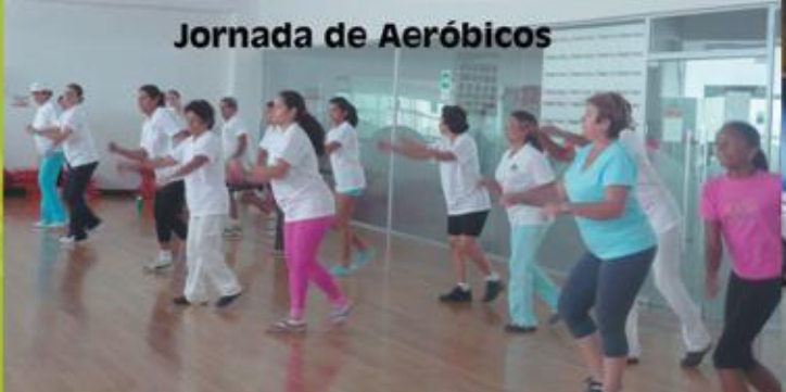
Jornada de Aeróbicos