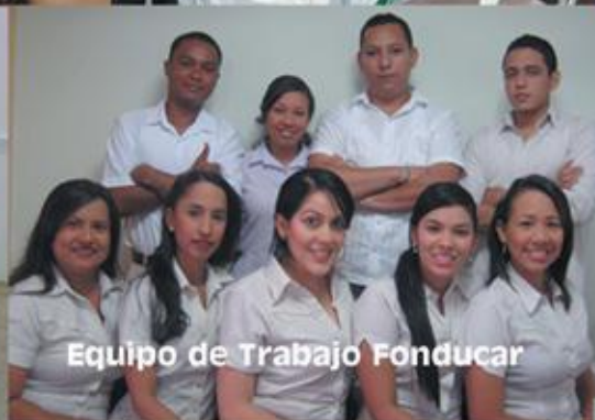
Equipo de Trabajo Fonducar