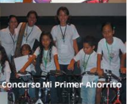
Concurso Mi Primer Ahorrillo