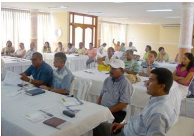
Seminario de Economía Solidaria. El Decreto 1481 de 1989 establece que es un deber de todo asociado capacitarse en Economía Solidaria.

En el Primer Congreso de Investigación del Sector Solidario realizado en Bogotá - Colombia, noviembre año 2004, el reconocido investigador social Antonio Elizalde Hevia 1 , revisó de manera magistral el tema de la conceptualización de la "Solidaridad", y sus aportes son de sumo interés por cuanto "la Solidaridad" es el eje orientador de nuestra misión institucional. Llama la atención las diversas aristas desde donde el investigador aborda la temática, discusión pertinente y oportuna, ya que en los últimos encuentros de asociados para diversos fines, se han entablado interesantes debates al respecto. Valga aclarar que con este escrito no se pretende concluir sino ante todo, aportar una gota a este interesante ejercicio intelectual.