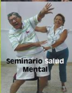
Seminario Salud Mental