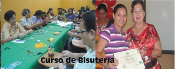
Curso de Bisutería