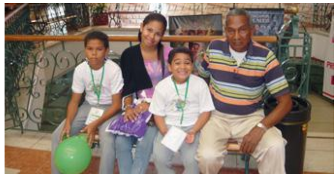
En el concurso Mi Primer Ahorro se enseña a los niños la importancia del ahorro.

directivo, funcionarios, y asociados de base, comprometidos y preparados para enfrentar los retos que imponen la administración y conducción de la empresa común, tanto hoy como en el devenir de la entidad. Por ello, es fundamental y obligatorio, según mandato legal y estatutario, que todos los asociados al Fondo estén en la disposición de capacitarse en la doctrina y principios administrativos y solidarios para entrar en escena cuando las circunstancias así lo requieran. El Comité de Bienestar Social tiene entre sus actividades y funciones prestar apoyo efectivo al logro de este propósito, con miras a garantizar los lógicos relevos generacionales que marca, por fuerza, la dinámica del tiempo. No hay duda que con la formación solidaria, tanto en la práctica como en sus valores y principios inspiradores, se logra no sólo el bienestar de las partes involucradas, sino el fin último de tener mejores ciudadanos dentro del entorno social de Fonducar y de la sociedad en general.