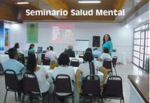
Seminario Salud Mental