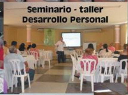
Seminario - taller Desarrollo Personal