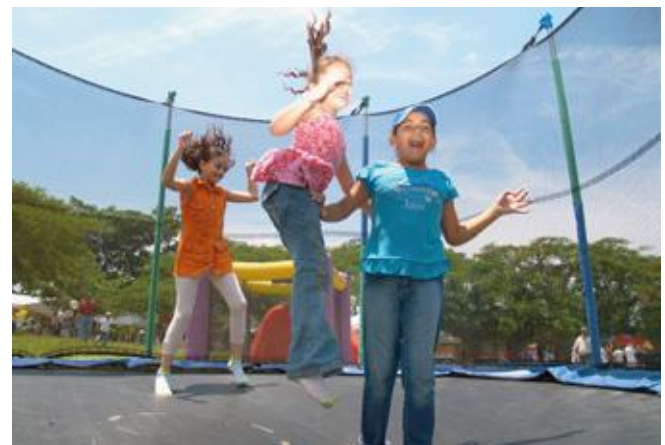
Fonducar promueve espacios de integración y recreación para el asociado y su familia.