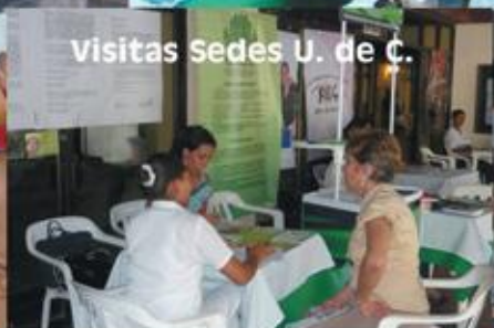
visitas Sedes U. de C.