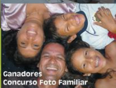
Ganadores Concurso Foto Familiar