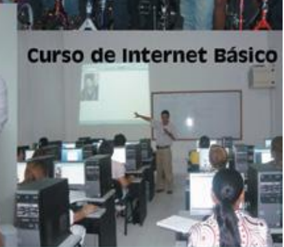
Curso de Internet Básico