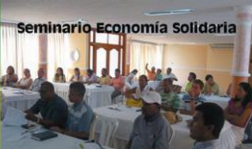
Seminario Economía Solidaria