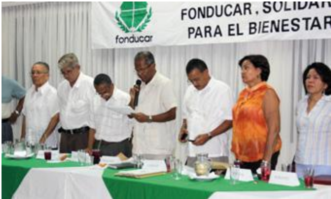
Junta Directiva de Fonducar, organismo que regula las políticas para el bienestar de los asociados y direcciona el cumplimiento de las decisiones tomadas por la Asamblea.

El Plan Estratégico de Desarrollo, 2007-2011, el Plan de Mercadeo Social, 2009-2014 y el Sistema de Gestión de Calidad, conducente a la certificación; y, más recientemente, la Reforma Estatutaria, por medio de la cual se introdujeron cambios que actualizan los Estatutos a la normatividad legal vigente e incorporan en forma clara los regímenes de incompatibilidades y sanciones para administradores, directivos y asociados, son los medios expeditos para alcanzar los objetivos generales y específicos de Fonducar, dentro de un marco de integridad, autonomía y democracia. Los tres primeros estudios ya vienen mostrando sus resultados, a través del impulso de acciones administrativas y de servicios que apuntan al bienestar general de los asociados y familiares. El 2010 ha sido declarado por la Junta Directiva como el “Año del Bienestar Social”. Dignos de mencionar están las nuevas líneas de crédito (educación, turismo, compra de cartera y comercial), con plazos más amplios, disminución de las tasas de interés de algunas líneas, captación de ahorros de los asociados a través de CDATs, impulso a las actividades de bienestar y de solidaridad, entre otras. Además, el mejoramiento de la eficiencia y eficacia en la gestión administrativa y en la prestación de servicios mediante el sistema de Gestión de la Calidad que se viene implementando.