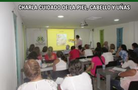
CHARLA CUIDADO DE LA PIEL, CABELLO Y UÑAS