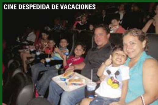
CINE DESPEDIDA DE VACACIONES