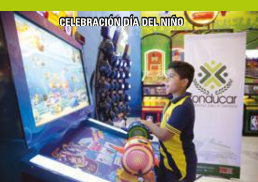
CELEBRACIÓN DÍA DEL NIÑO