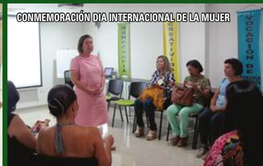
CONMEMORACIÓN DIA INTERNACIONAL DE LA MUJER