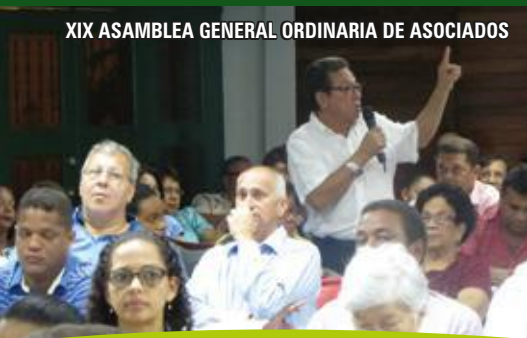
XIX ASAMBLEA GENERAL ORDINARIA DE ASOCIADOS