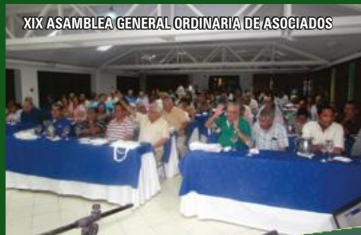
XIX ASAMBLEA GENERAL ORDINARIA DE ASOCIADOS