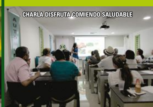
CHARLA DISFRUTA COMIENDO SALUDABLE