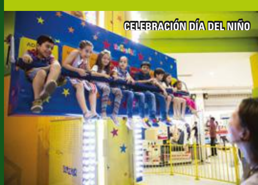
CELEBRACIÓN DÍA DEL NIÑO