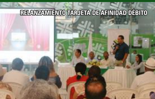
RELANZAMIENTO TARJETA DE AFINIDAD DÉBITO