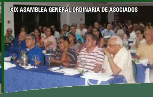
XIX ASAMBLEA GENERAL ORDINARIA DE ASOCIADOS