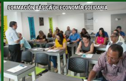
FORMACIÓN BÁSICA DE ECONOMÍA SOLIDARIA