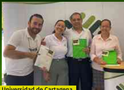
Universidad de Cartagena Piedra de Bolívar