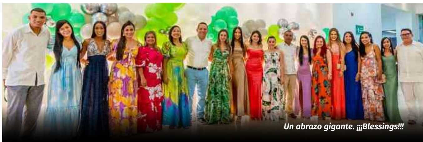
Un abrazo gigante. ¡¡¡Blessings!!!

Hoy elevo una oración por los compañeros y familiares que han partido a su eterno descanso, con la esperanza que Dios los acoge en su Santo Reino y a nosotros nos permita tener la fuerza y la voluntad para seguir adelante. Espero seguir contando con el Fondo para seguir aportando al Bien-Estar de mi familia, desde nueva sede presencial, muestra de que seguimos creciendo por todos y para todos.