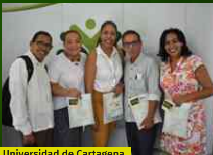
Universidad de Cartagena San Agustín