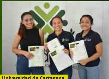
Universidad de Cartagena San Agustín