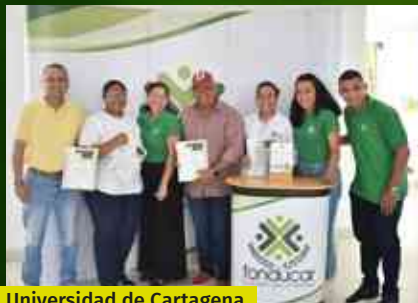
Universidad de Cartagena San pablo