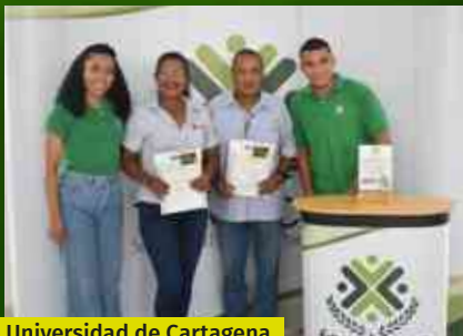
Universidad de Cartagena San pablo